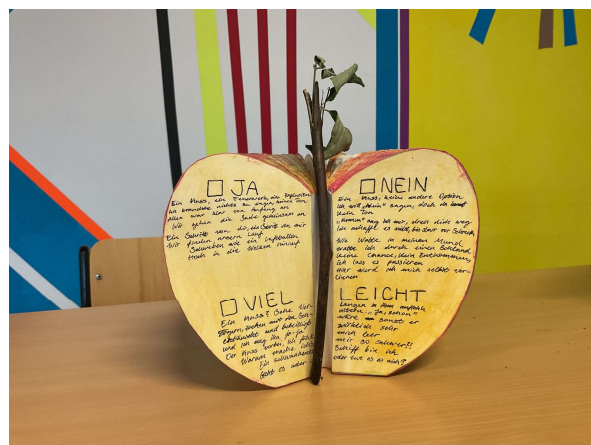
Abbildungen: Ergebnisse einer kreativen Schulaufgabe zum Thema Konsens

Herausforderungen in der Präventionsarbeit durch fehlende schulische Schutzkonzepte Vor mittlerweile acht Jahren fand in Hamburg der offizielle Auftakt der Initiative „Schule gegen sexuelle Gewalt“ des Unabhängigen Beauftragten für Fragen des sexuellen Kindesmissbrauchs der Bundesregierung statt. Die Initiative hat das Ziel, alle 30.000 Schulen in Deutschland bei der Entwicklung von Konzepten zum Schutz der Kinder und Jugendlichen vor sexualisierter Gewalt zu unterstützen.